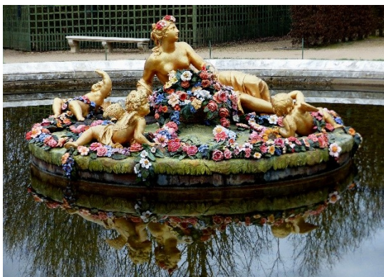
Flore et Cérés il fallait leur montrer !