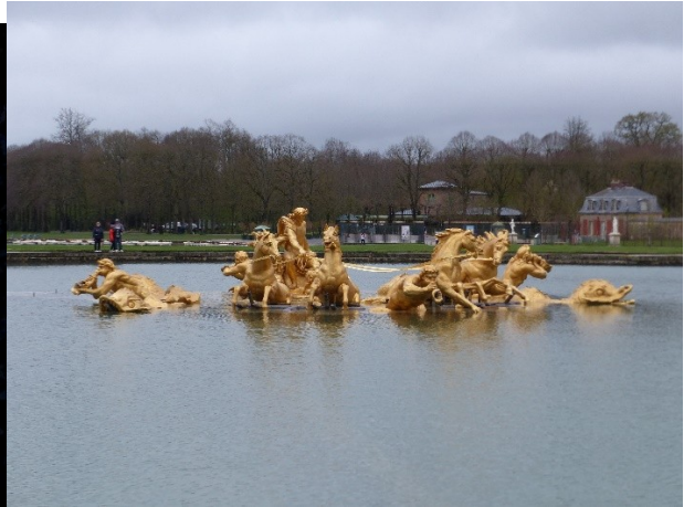
Puis au char d'Apollon, et enfin l'Encelade !