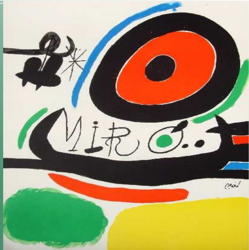
Tres Libres de Miró en 1970. (56 cm x 76 cm)

La « Fondation Miró » a été fondée en son honneur à Barcelone en 1975. C'est un centre culturel et artistique consacré à la présentation des nouvelles tendances de l'art contemporain. Elle est au départ financée par un important fond offert par le maître. La Fondation Pilar et Joan Miró de Palma de Majorque, le Musée national d'art moderne de Paris, le musée d'art moderne de Lille et le Museum of Modern Art de New York sont d'autres lieux qui possèdent des œuvres de Miró.