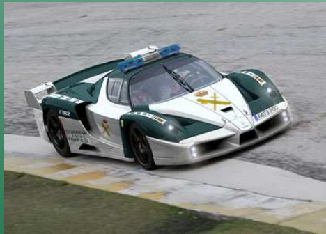
Véhicule d'interception rapide de la guardia civil

En Espagne, on trouve 3 échelons de police : la guardia civil, police militaire nationale , la police régionale , financée par la communauté autonome à laquelle elle est rattachée , et la policia local , police municipale.