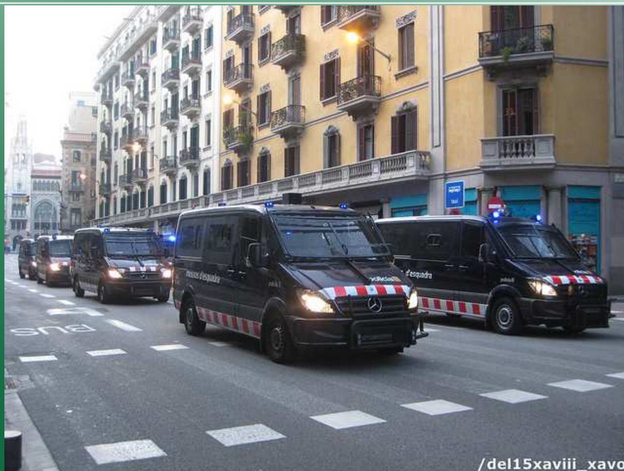
Les fourgons de l'unité antiémeute suivent de près les cortèges de manif

Chaque communauté indépendante d'Espagne possède également sa propre force de police : en Catalogne par exemple, on trouve les « mossos d'esquadra », l'une des forces de police civile les plus anciennes d'Europe, créée en 1721, et qui a pour rôle très délicat le déminage et la lutte antiémeute en Catalogne, des missions très récurrentes en ces temps d'instabilité politique. Viennent enfin les polices municipales, appelées « policia local » financées par les municipalités et qui s'occupent essentiellement de la répression des larcins dans les villes affectées par le vol à l'étalage.